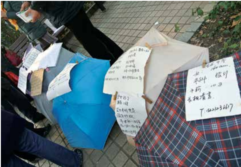
04 人民公園相親角。不論寒暑，每週末都擠滿了代替兒子 女兒找對象的父母親，兒女負責談戀愛，父母負責談生意