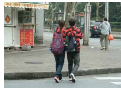
05 愛情是把兩人變成一人的過程，自我的個性常不被允許

幸好，中國人的「不安全感」強大過一切理智：我們永遠在擔心還沒發生的事，最好一出生，就能在命盤裡、臉孔裡、掌心的皺折裡，看到這一生的預告。