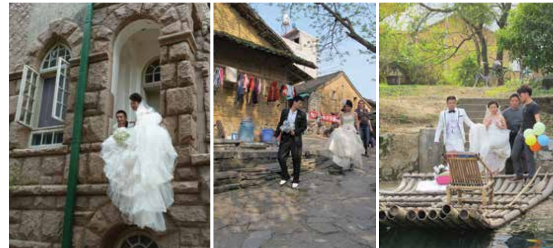
02 所有依山傍海的景區都能見到前來海誓山盟的新人

會議室裡，我們用運用各種行銷心理學來販賣婚姻；會議室外，城市裡每天都上演著真實的愛情交易。