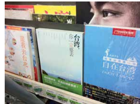
03 「台灣小清新旅遊」 在上海相當暢銷

正因為「大氣」變得如此形式化，所以當我看到另一張brief上小氣地寫著：標題要換成「大氣」的免費字體時，也只能以更大氣的笑聲回應了。