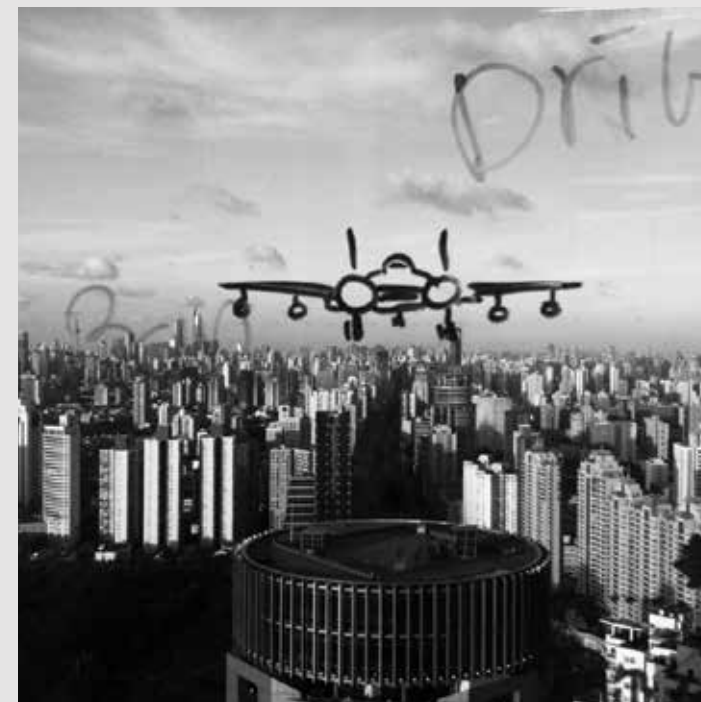
01 上海——夢想起飛與降落之地

「為什麼，精神只能在物質的床榻上入睡？」 ——《白晝倚在夜晚的肩膀》· 阿多尼斯