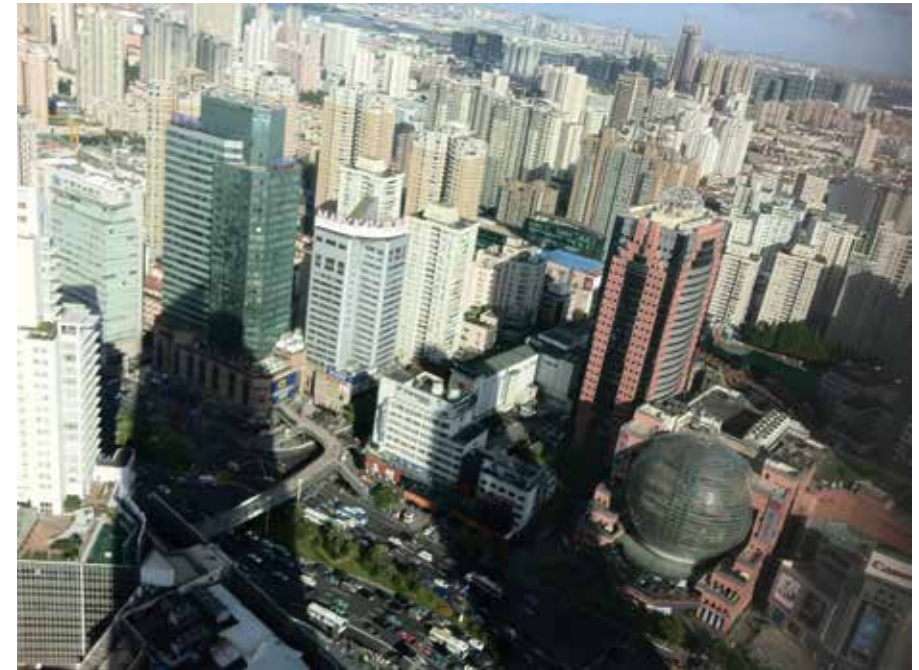
04 夢想是一座看不到頂的梯子，總會有更高的樓覆蓋你的成就

時間、身體、才華，你意識到傳說中的夢想，竟是個索求無度的怪獸、冷酷無情的萬人迷。它以年輕人的熱情為糧，接著耗盡了中年人的精華，最終吞噬你一生的努力。僅少數的幸運兒得到金錢的回報。