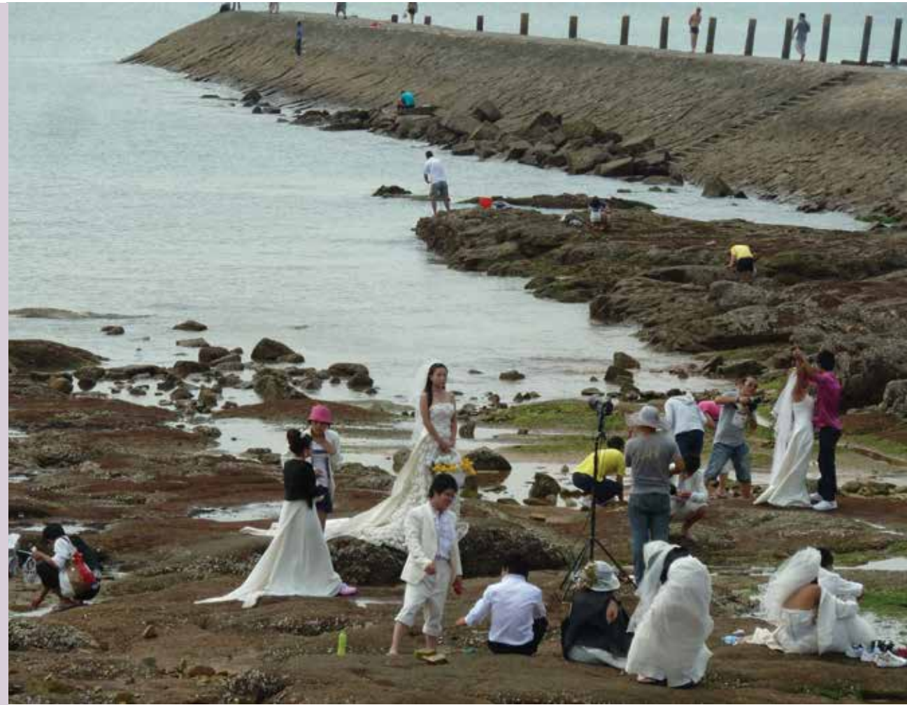
01 青島的婚紗攝影大片場