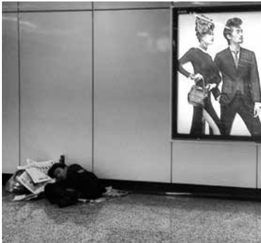
03 走向成功的人們，不會為失敗的人停下腳步

在上海，一切各憑本事，只要有才華、有手腕、有體力、有魅力、有美麗、有點子，甚至騙術高人一等，只要你身上有其它人想要的東西，就能貼上標價，憑實力累積更多財富，買到你個人定義的夢想，達到令人豔羨的成功人生。上海許諾了人們一個「公平」的起點，並且比其它城市更懂得使用一個公平的單位——人民幣。